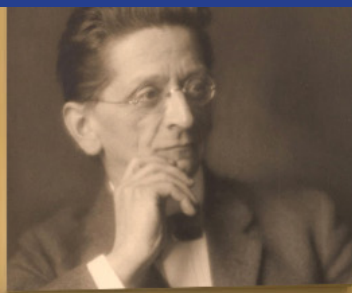
Alexander von Zemlinsky Cello Sonata (1894)